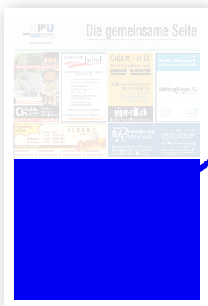
1/2 Seite Publireportage

Publireportagen: Ihre Botschaft in Text und Bild, eingebettet ins redaktionelle Layout – für maximale Wirkung bei den Leser:innen.