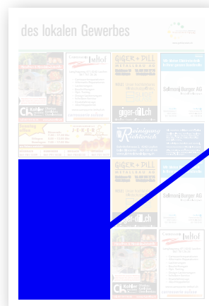
1/4 Seite Publireportage