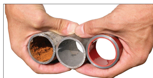
Verschmutztes, gereinigtes, beschichtetes Rohr.

werden die Rohre innen mit einer speziellen Beschichtung versiegelt und langlebig geschützt. Das Endprodukt ist ein Art «Rohr-in-Rohr-System», das den heutigen Kunststoffrohren punkto Dauerhaftigkeit und Qualität in nichts nachsteht.